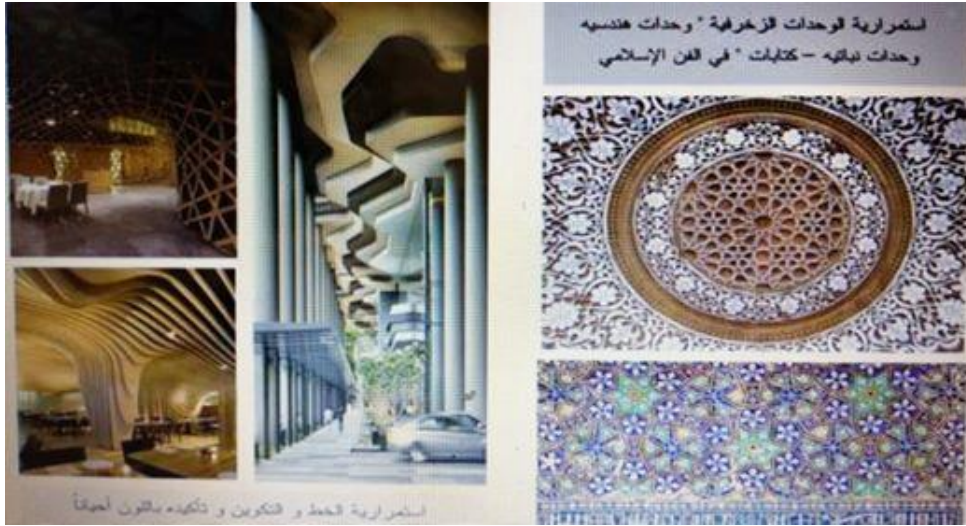
شكل(4): بعض النماذج التي توضح الاستمرارية في الفن الإسلامي والفكر التصميمي المعاصر

لحقيقة لا تتعلق بمكان وزمان، مما يدخلها في متوالية لانهائية من الإنبثاقات التجليات الدلالية ومن ثم يصبح الشكل في حالة ارتقاء مستمر على مستوى الشكل والمضمون، وتحليل تلك الزخارف ندرك بأنها لم تكن عشوائية، بل هي زخارف مجردة لا نهائية ظاهرها جمالي وباطنها تعبدي تحمل معاني رمزية وتؤدي وظيفتها في المكان التي وجدت فيه (الألوسي، 2003).