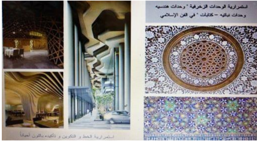
شكل (1): نماذج لتحقيق الوحدة في الفن الإسلامي

(ب) وحدة التوجيه: تنشأ وحدة التوجيه من انطلاق الفراغ من نقطة مركزية وحولها يتكوّن الشكل، شكل (1، أ، ج).