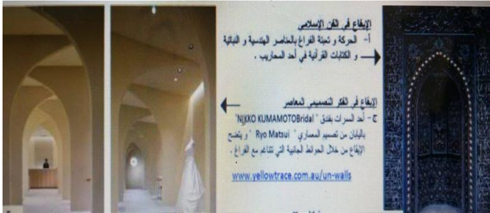
الشكل (2) يمثل الإيقاع في الفن الإسلامي والإيقاع في الفكر التصميمي المعاصر.

2- الإيقاع (Bhythm): يعد الإيقاع من أهم الصفات الكامنة في الفن الإسلامي والمحددة للسمات التصميمية له، ويؤكد الدكتور "عبد الباقي إبراهيم" أن الإيقاع هو مفردة تقع ضمن مفهوم أشمل أطلق عليه مصطلح "التنغيم" الذي تم اعتباره أحد قيم الفن الإسلامي التي تتضح عبر المستويات التشكيلية المختلفة، وينشأ الإيقاع من خلال حركة وتكرار واستمرارية العناصر الهندسية والنباتية والكتابية. ومن هنا تتبع الخصوصية الزخرفية في الفن الإسلامي والتي لا تتناقض مع خصوصية التأمل، كما يهتم الإيقاع في الفن الإسلامي بالكشف عن الجوانب الداخلية العميقة للحقيقة العليا، وعلى هذا الأساس فإن الإيقاع يشير إلى عدد من دلالات الشكل والمضمون في العمل التصميمي (عصفور، 2012، ص541).